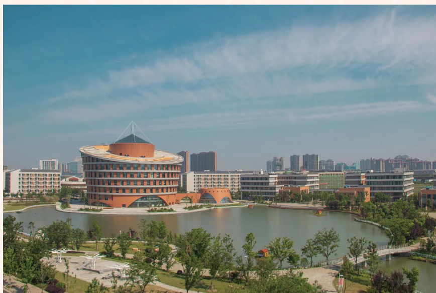
封底图片/无锡学院