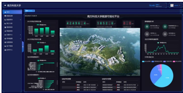
图 1 南方科技大学节水系统管理平台

对学校重点区域及各楼栋用水实现分级计量，建立节水系统管理平台，对各楼栋用水量、水压在线监测，实现用水计量、监测、存储、报送、分析、预警等功能，如图 1 所示。