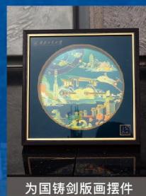
为国铸剑版画摆件

国之重器的背后,离不开西工大人的默默奉献与付出。在飞天巡洋的路上,西工大人追求三航报国与三航强国。校园里矗立的勇士雕塑俯首托剑,代表的正是“为国铸剑、献身国防”的西工大精神。雕塑背后茂盛的树木,则象征西工大人在祖国三航事业中立下的一座座不朽丰碑。