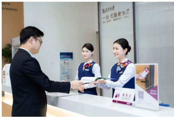
图 3 南京大学苏州校区服务台

新建高校的咨询与服务模式。近年新建高校或校区更多的是为服务国家战略、解决“卡脖子”问题因素，较 20 年前为应对高等教育普及扩大招生而大兴土木的情形有了明显改变，规划设计也有了更为高新的要求，如康复大学、西安交通大学创新港、大湾区大学、南京大学苏州校区、北航中法学院等，都以不同的使用功能特点，去实现崭新的运行蓝图。值得提及的是，苏东吴近五年承接的新建高校或校区 20 余所，管理面积逾 600 万平方米，居物业企业在管相关项目之首，实施 (SFMS) 苏东吴设施管理服务模式，反映出了苏东吴非核心业务的总承包实力，高校服务业务的支持能力，以及对新建高校或校园的品牌影响力。依仗苏大教服强劲的研究力量，为解决新建高校校园从“0”到“1”的发展，苏东吴探索建立了从规划设计期的运维咨询到校区交付前的运行组织体系架构与运行制度的建设咨询，再到运行实施的全过程服务，将理想化的物业管理规范设计变为能够落地使用的实践案例，其价值意义非凡。