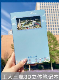
工大三航3D立体笔记本

蓝天白云、碧树红花、青山之上、飞天巡洋,分层笔记本运用新颖的纸雕工艺,将西工大三航特色与校园景致巧妙结合。