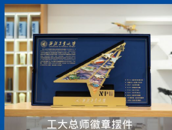
工大总师徽章摆件

与中国邮政联合发行。“威龙”歼-20、“鲲鹏”运-20、“入云龙”直-20、“鲲鹏”AG600四型飞机由西工大杰出校友总师设计,并亲笔签名。该邮票蕴藏黑科技,用支付宝AR扫一扫功能可观看鹰击长空、物资投放、平台起降、取水灭火等壮观场景,完美展现了西工大人胸怀壮志、逐梦蓝天、国之重器、劲舞苍穹的景象。