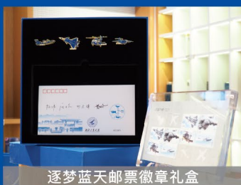
逐梦蓝天邮票徽章礼盒

与中国邮政联合发行。“威龙”歼-20、“鲲鹏”运-20、“入云龙”直-20、“鲲鹏”AG600四型飞机由西工大杰出校友总师设计,并亲笔签名。该邮票蕴藏黑科技,用支付宝AR扫一扫功能可观看鹰击长空、物资投放、平台起降、取水灭火等壮观场景,完美展现了西工大人胸怀壮志、逐梦蓝天、国之重器、劲舞苍穹的景象。