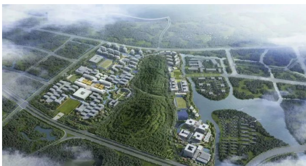
图2 南京大学苏州校区效果图

“一切以学生为中心”在新校区建设中得以生动诠释，不但丰富与拓展了高校物业管理的内涵与外延，更在于成就出高校后勤服务保障体系建设的创新模型，一定意义上代表着后勤服务生产力发展水平，也寓意着现代企业运行模式成为高校后勤事业发展中的不可或缺的力量。