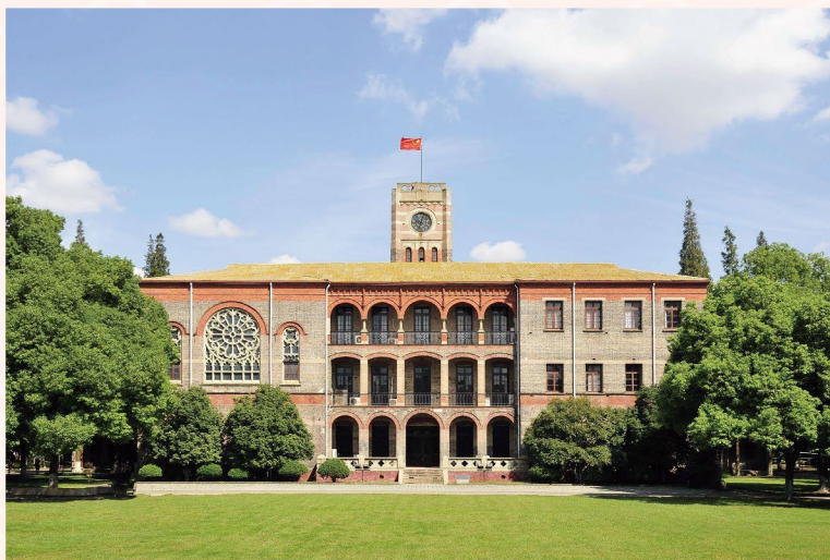
封底图片/苏州大学