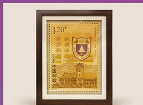
南大云锦邮票摆件