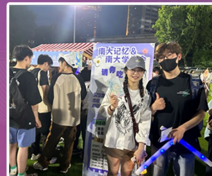
联合校学生会集市活动

南大记忆文创开发按全品类开发、按时段节点专题开发，秉承优质、优价、优品的原则，拓展合作领域，精进设计工艺水平。深入市场调研、不定期召开研讨会，广泛征询师生校友建议，着力打造能够讲述生动故事，呈现艺术内涵。努力联合学校文化部门，深入挖掘南大文化脉络，不断提升产品文化内涵。开设劳育课堂，提升文化育人功能，增强大学生文化自信。树立富含南大底蕴、彰显南大精神的品牌形象。