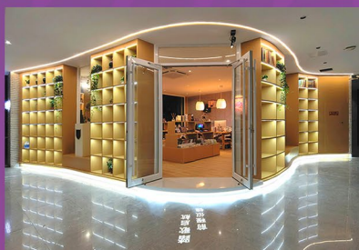
南大记忆仙林工作室