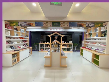
南大记忆&南京邮政联名店