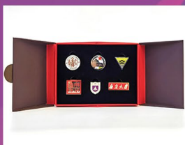
南大历届徽章礼盒