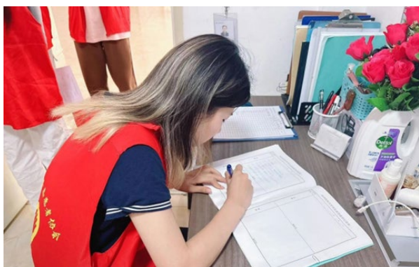
图1 填写宿舍值班记录表

时间管理、自我约束能力的提升,以及对宿管员工作的新认识;探讨如何提升宿舍管理水平,鼓励学生提出改善宿舍环境的建议(图1)。