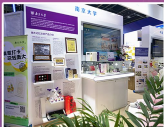
全国高校后勤展-文创展区