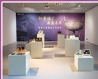
博物馆主题展-文创展区