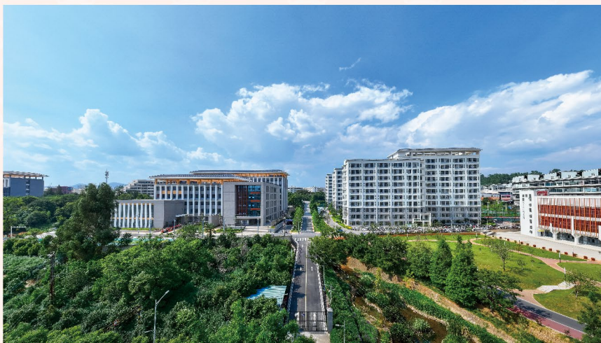
封底图片/西南林业大学