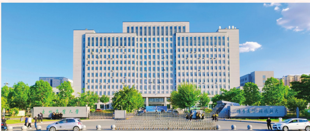
封底图片/东北农业大学